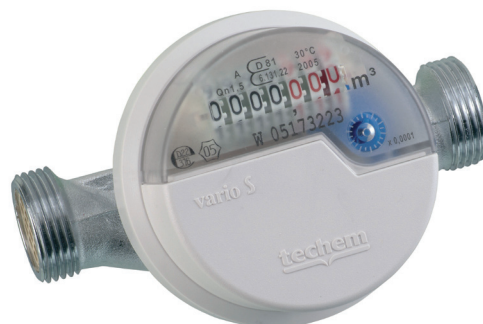
Compteur d'eau Vario S