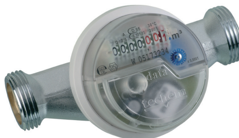
Compteur d'eau Radio III